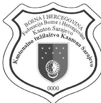
Izgled mesingane iskaznice